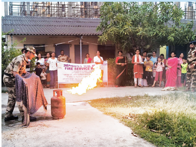
NPGCL, Nabinagar (Bihar)