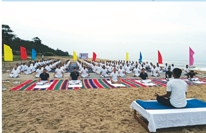
डीआई, कलपक्कम (तमिलनाडु)