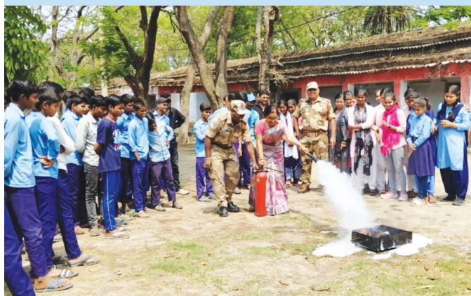
KBUNL, Kanti (Bihar)