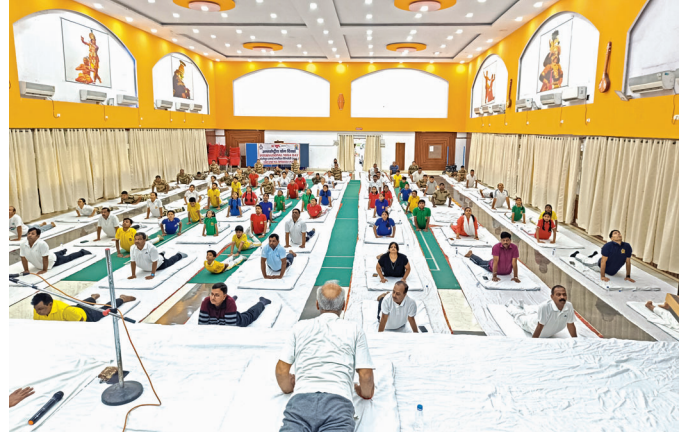
एनसीएल, सिंगरौली ( मध्य प्रदेश )