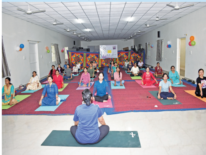
बैंगलोर एयरपोर्ट (कर्नाटक)