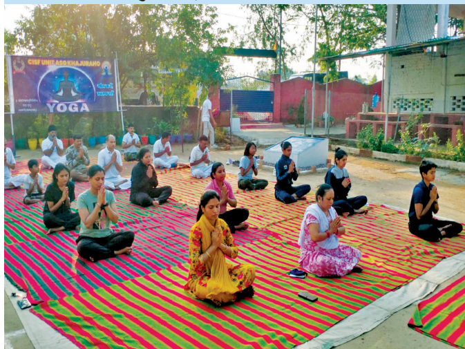
खजुराहो एयरपोर्ट (मध्य प्रदेश)