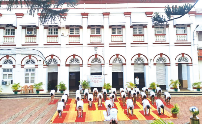
आईजी मिंट, मुंबई ( महाराष्ट्र )