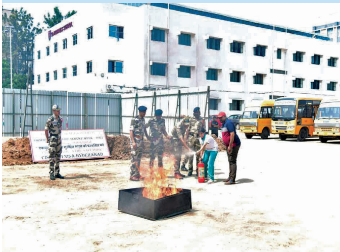
FSTI NISA, Hyderabad (Telangana)