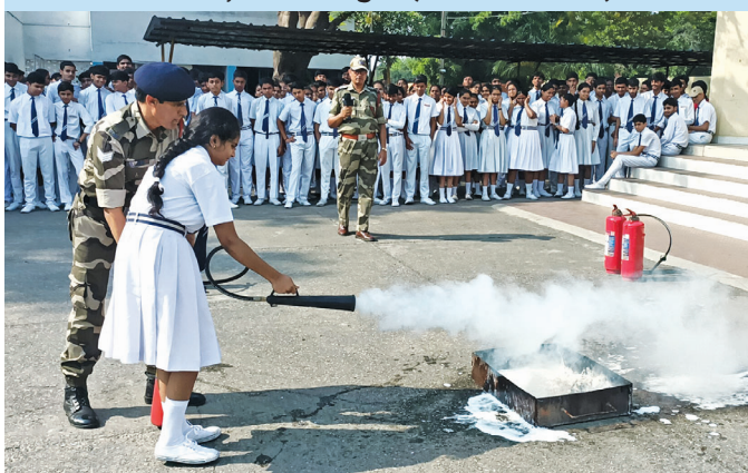
SSTPS, Shaktinagar (Uttar Pradesh)