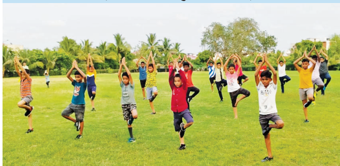
एनआरएल, नुमालीगढ़ ( असम )