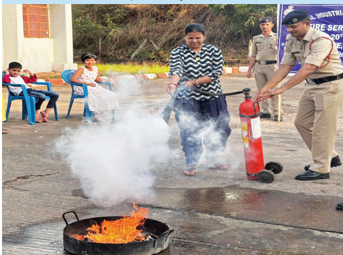
NALCO, Damanjodi (Odisha)