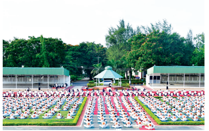
निसा, हैदराबाद (तेलंगाना)