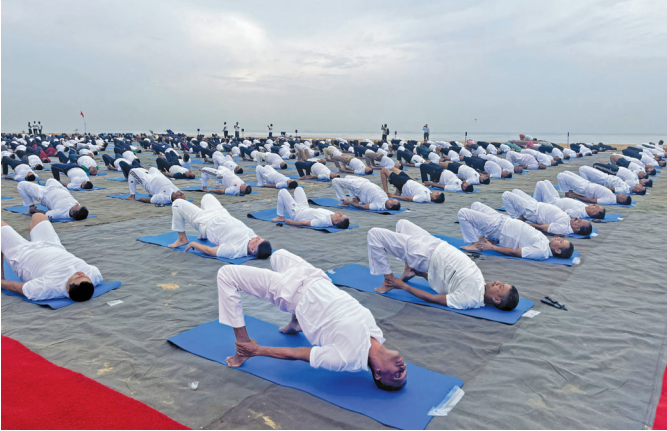
दक्षिण सेक्टर मुख्यालय, चेन्नई (तमिलनाडु)