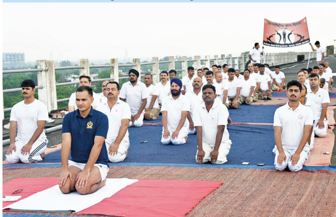
पीवीयुएनएल, पतरातु (झारखंड)