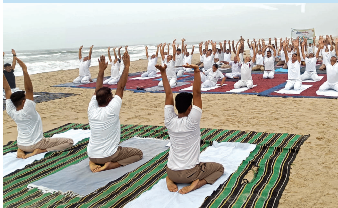
आईओसीएल, पारादीप (ओड़िशा)