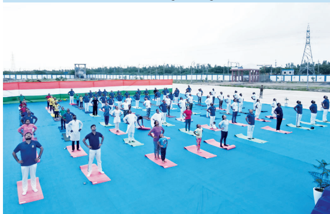
आईओसीएल, मुन्द्रा (गुजरात)