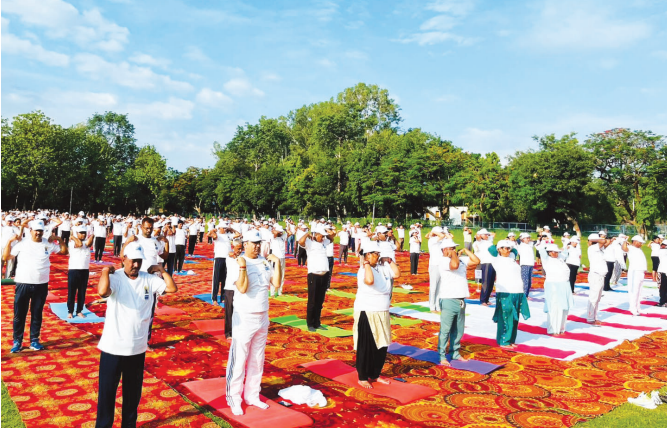
टीएचईपी, बनबसा (उत्तराखंड)