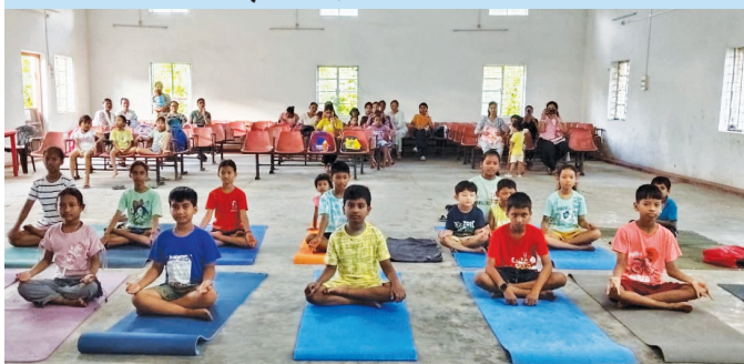
ओएनजीसी, नजीरा ( असम )