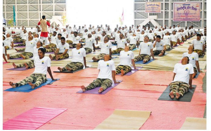
मुंबई एयरपोर्ट (महाराष्ट्र)