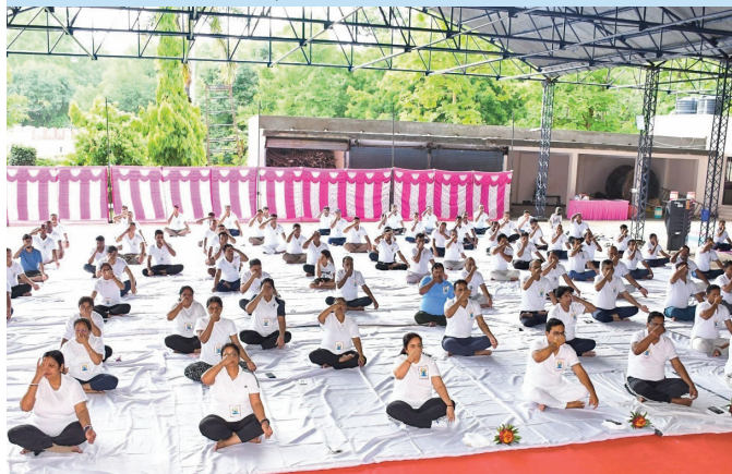
ओकेपीएस, खंडवा (मध्य प्रदेश)