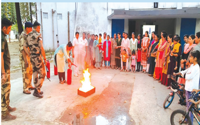
FGUTPP, Unchahar (Uttar Pradesh)