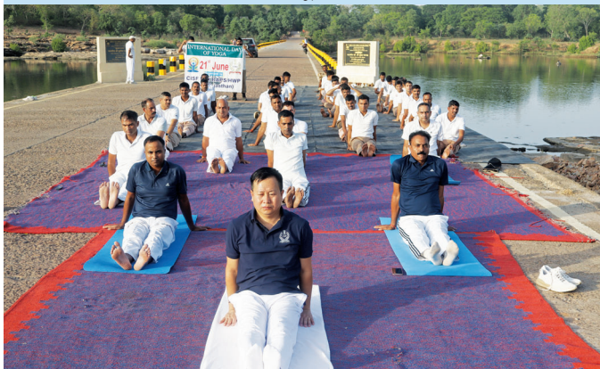
आरएपीएस एचडबल्यू, कोटा (राजस्थान)