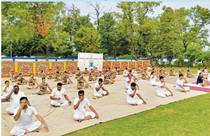
एसईसीएल, शीतलपुर (पश्चिम बंगाल)