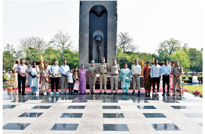
Family members of the CISF Bravehearts with Sr. Officers at the Central Sculpture at NPM, Chanakyapuri, New Delhi