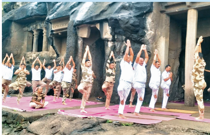
सीएनपी, नासिक (महाराष्ट्र)