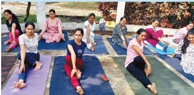
आईओसीएल, बोंगईगांव ( असम )