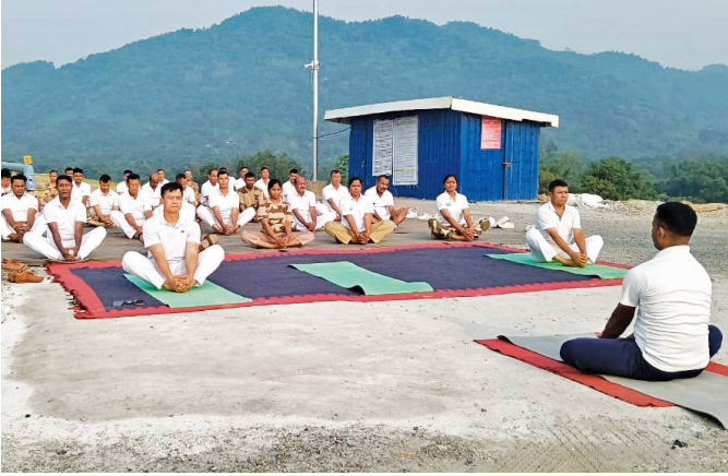
बीटीपीपी, बोंगोईगांव ( असम )