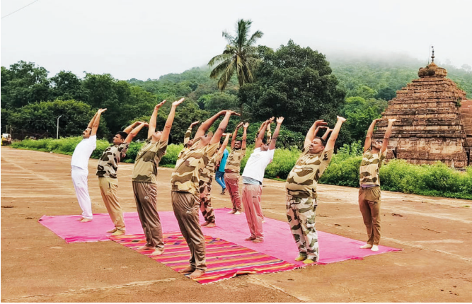
डीआईओएम, डोनीमलाई ( कर्नाटक )