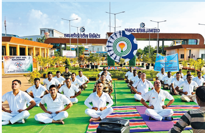
एनएसएल, नगरनार (छत्तीसगढ़)