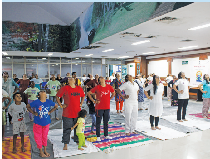
कालिकट एयरपोर्ट (केरल)