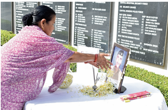
Family member paying homage to the CISF Bravehearts at the Wall of Valour