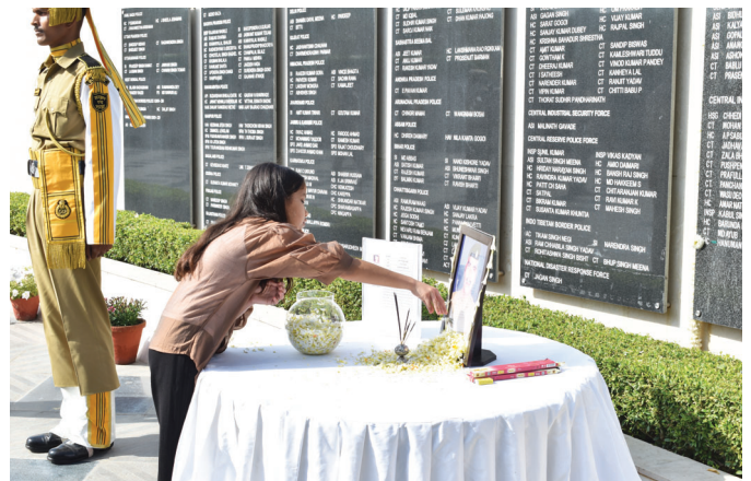
Family member paying homage to the CISF Bravehearts at the Wall of Valour