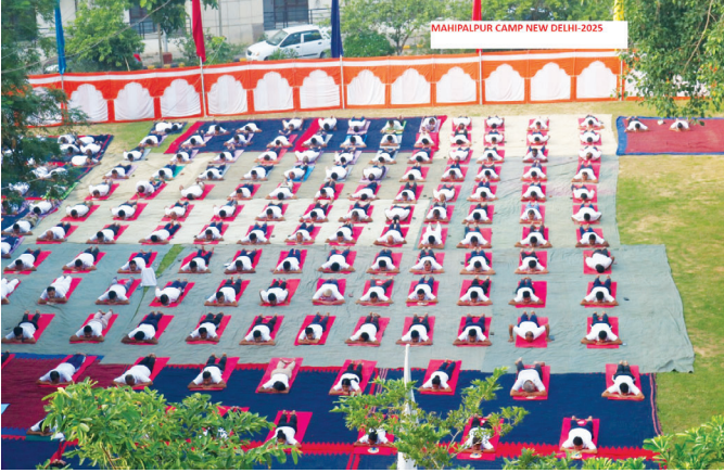
महिपालपुर कैंप, नई दिल्ली