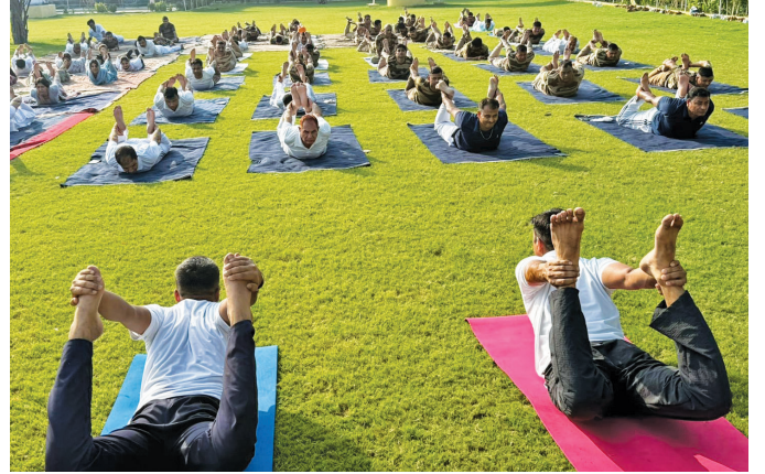
पीपीसीएल, बवाना ( दिल्ली )