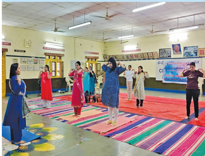
भेल हैदराबाद (तेलंगाना)