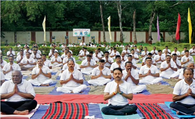
बीएसपी, भिलाई (छत्तीसगढ़)