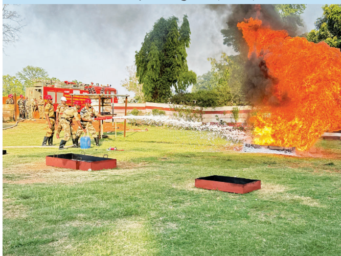
KHSTPP, Kahalgaon (Bihar)