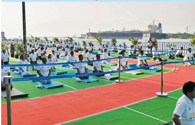
वीपीए, विशाखापट्टनम (आन्ध्र प्रदेश)