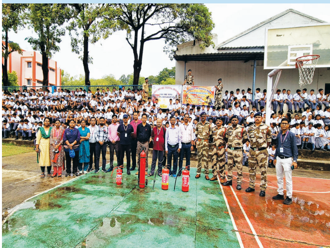
CTPS, Chandrapura (Jharkhand)