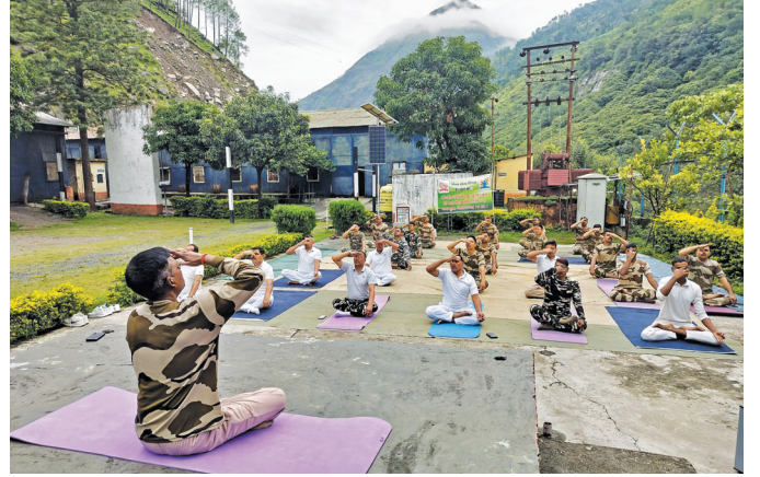
डीएचईपी, धौलीगंगा ( उत्तराखंड )