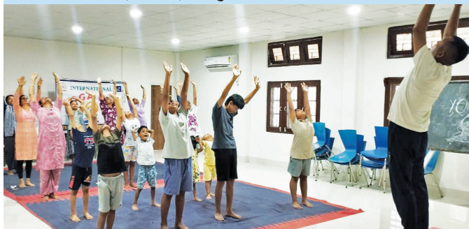
वीटीपीपी, वेल्लूर ( तमिलनाडू )