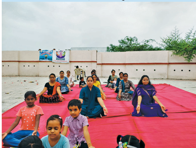
भावनगर एयरपोर्ट (गुजरात)