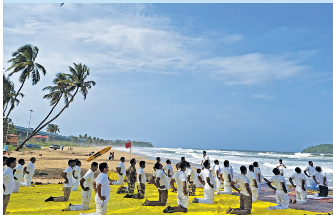
गोआ एयरपोर्ट (गोआ)