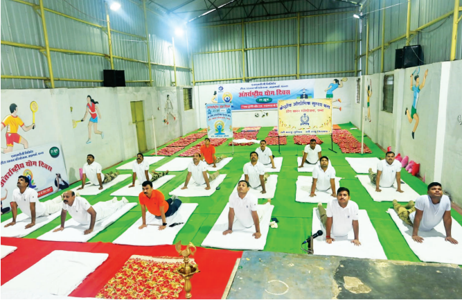
डीएमपी, पन्ना ( मध्य प्रदेश )