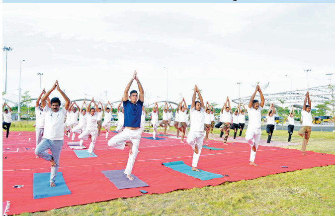
ट्रिची एयरपोर्ट (तमिलनाडु)