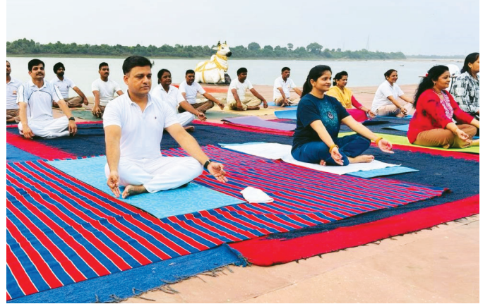
एसपीएम, नर्मदापुरम (मध्य प्रदेश)